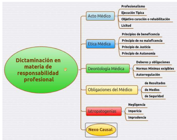
Figura 1. Responsabilidad profesional y definición