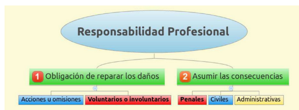
Figura 2. Elementos a considerar en la dictaminación médico legal